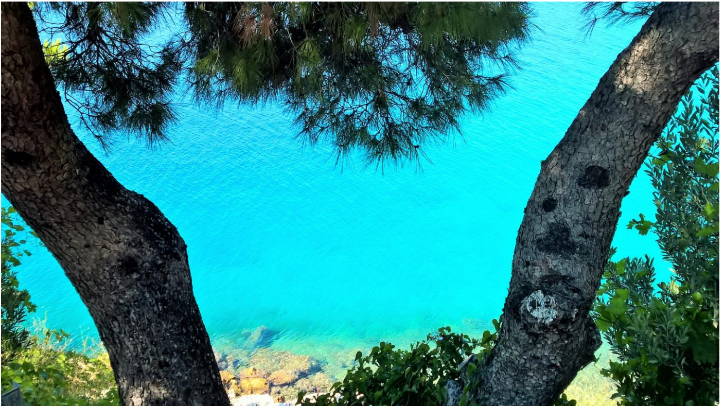
Nagy Tamara 6. a (SzRG) Kék lagúna