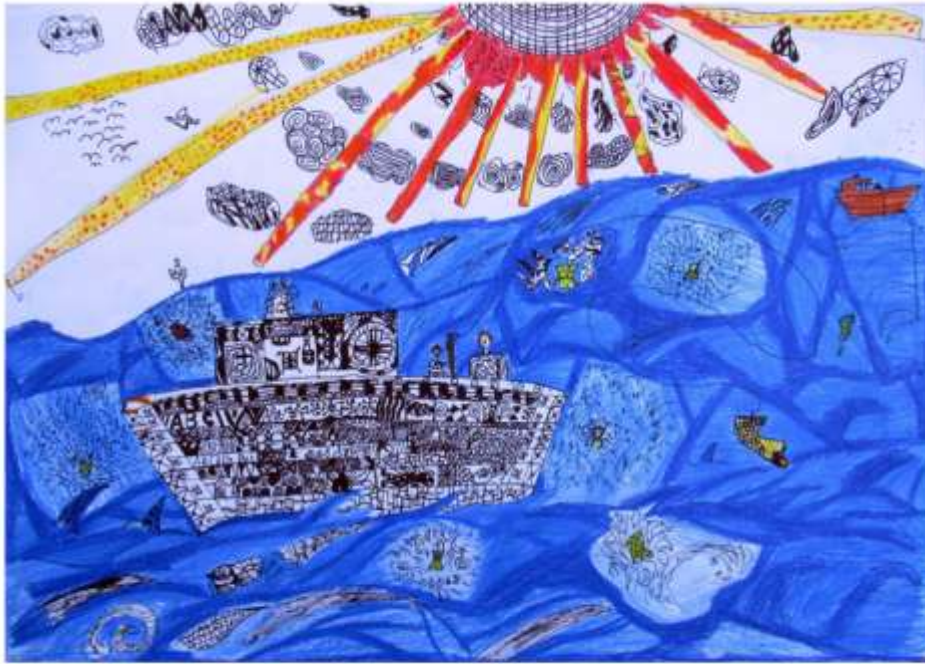
Porkoláb Izsák 4. o. I. hely