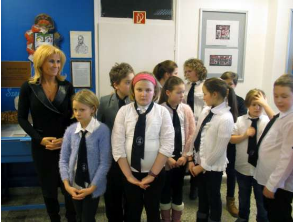
A Szerencsi Rákóczi Zsigmond Református Két Tanítási Nyelvű Általános Iskola versenyzői