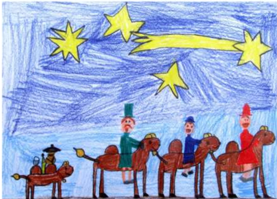
Budai Bernadett 2. o. I. hely