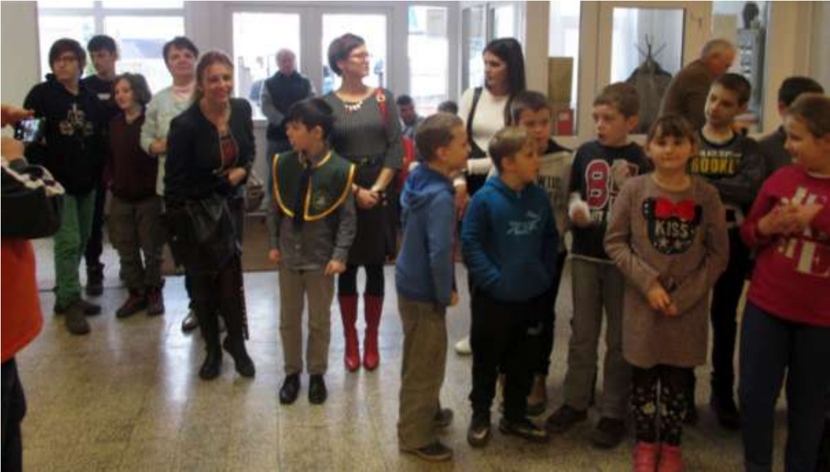
Az eredményhirdetés izgalmait