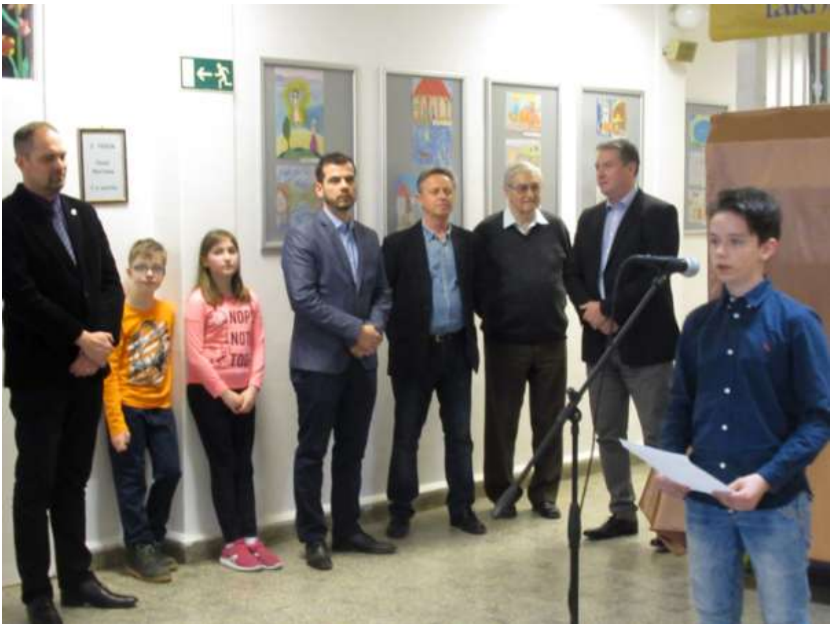
A Szenczi iskolás diákok verses, dalos kis műsorral tették még ünnepélyesebbé a kiállítás megnyitóját.