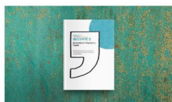
INTERNATIONAL ADAPTATION TOOLKIT (ADAPTÁCIÓS SEGÉDLET ANGOL NYELVEN)