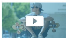
FIATALOK MENTÁLIS EGÉSZSÉGE – FELNŐTT SZEMMEL