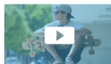
FIATALOK MENTÁLIS EGÉSZSÉGE – KORTÁRS SZEMMEL