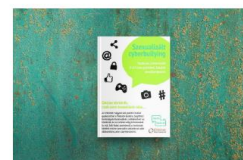
TANÁCSOK ÉS INFORMÁCIÓK NEVELŐSZÜLŐKNEK