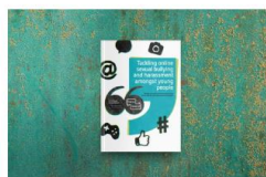
IMPACT REPORT (KUTATÁSI JELENTÉS ANGOL NYELVEN)