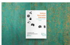
A SZÜLŐK SZEREPE AZ ONLINE VISSZAÉLÉSEK MEGELŐZÉSÉBEN