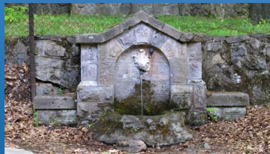
Szent László forrás

Forrás: https://guideathand.com/hu/sight/a-szent-laszlo-forras