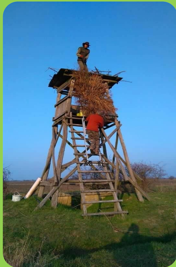
A műfészkek felhelyezése