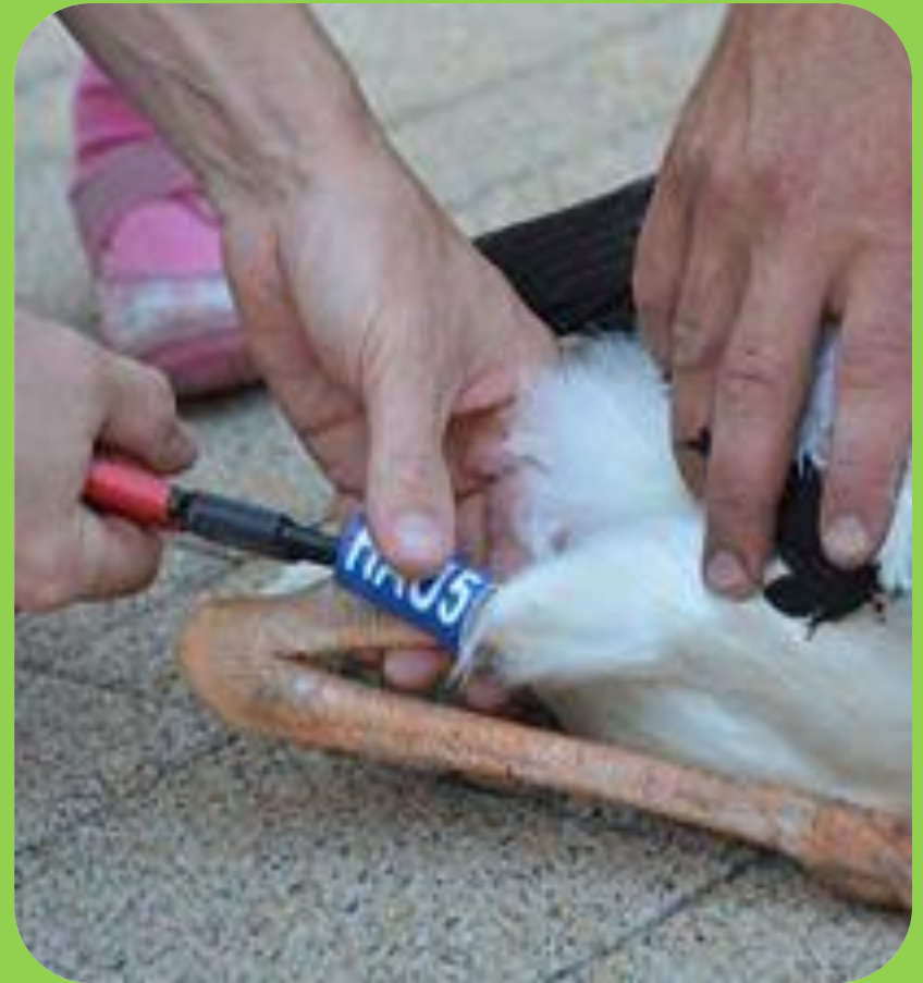
Gólya Road-Show 2.