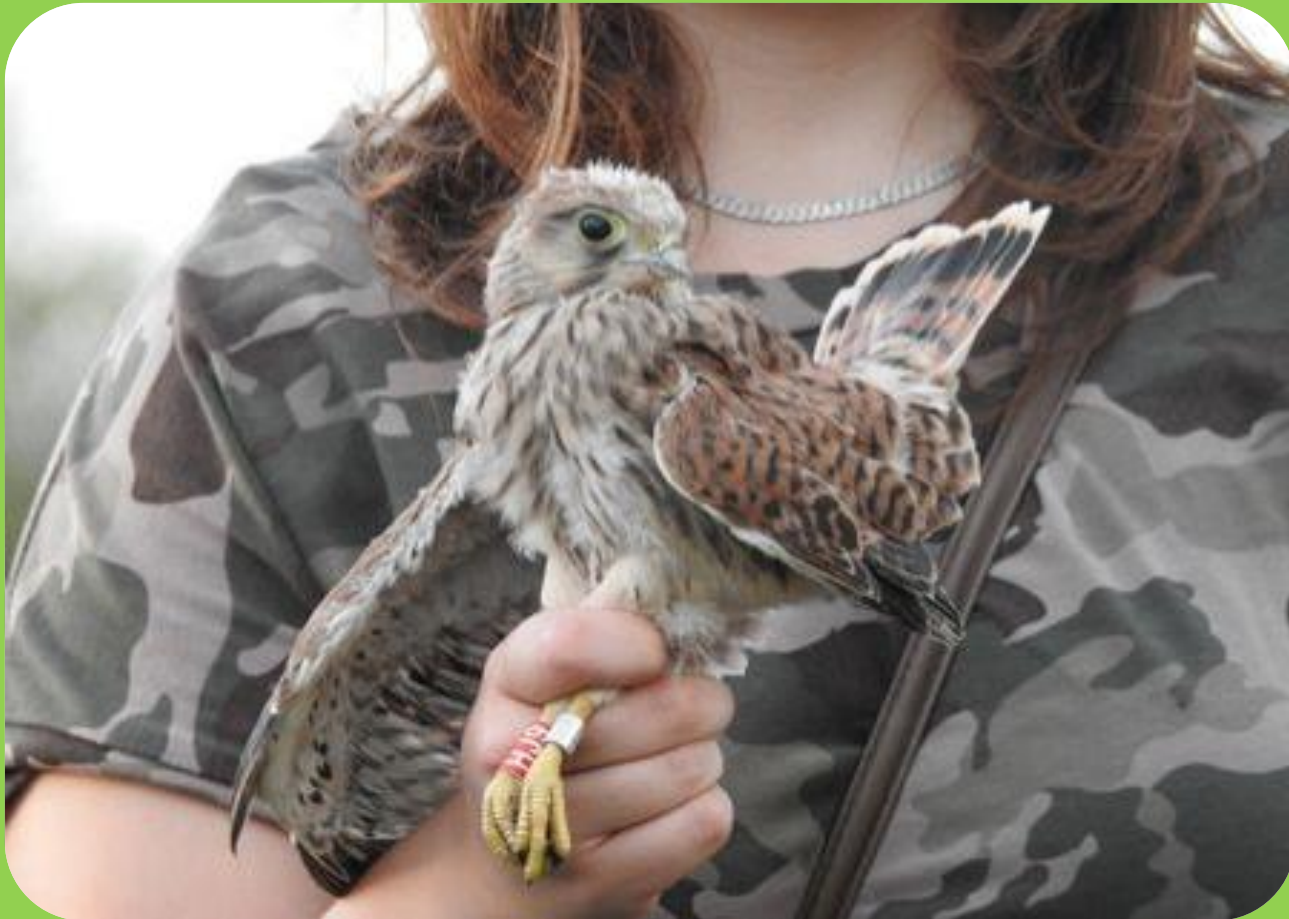
Meggyűrűzött fiatal vörös vércse