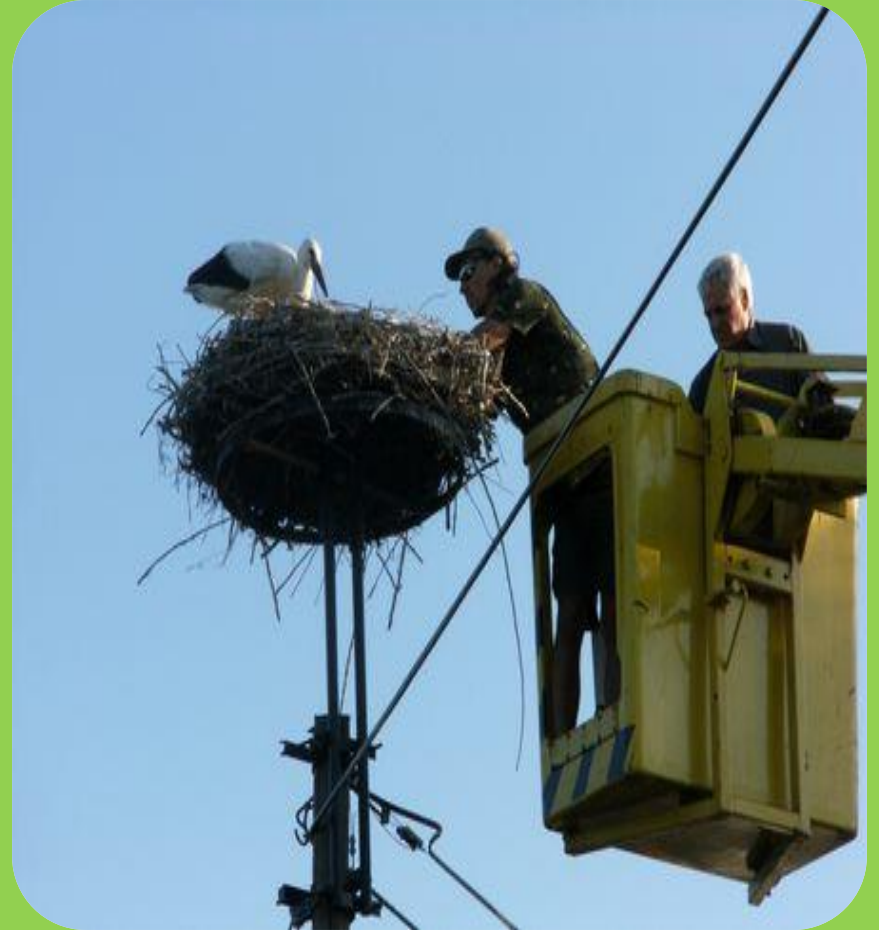
Gólya Road-Show 1.