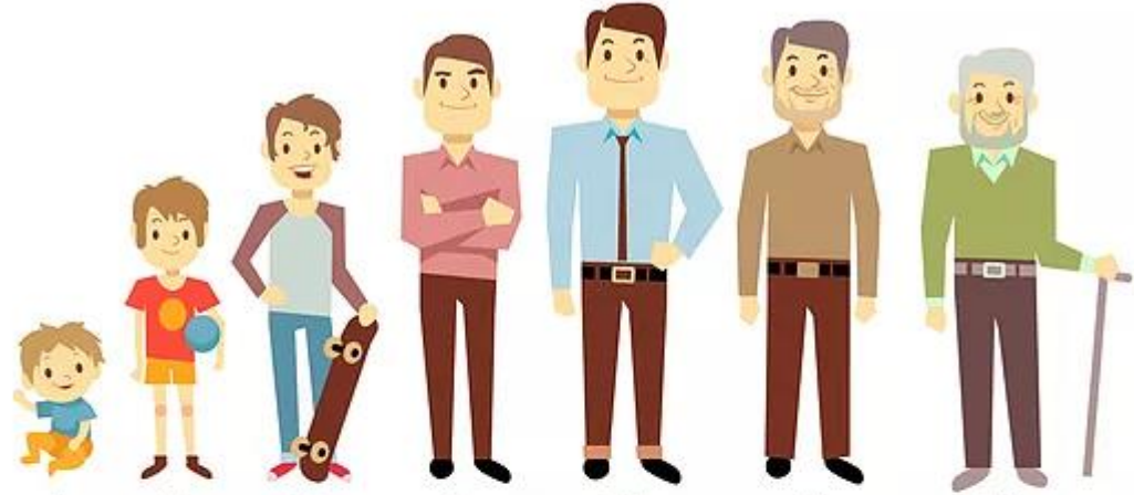
1 5 13 23 35 50 70 Alfa Z Y X Baby Boomer Veterán